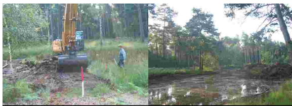
Renaturierung Heidemoor

Het Grenspark Maas-Swalm-Nette is als aanvrager van dit project verantwoordelijk voor de inhoudelijke coördinatie en financiële afwikkeling van het project. Zij stelt de kwartaalberichten op en rekent de subsidiemiddelen voor de afzonderlijke projectpartners met de euregio af. De uitgevoerde werkzaamheden binnen de afzonderlijke deelprojecten worden hieronder kort weergegeven.