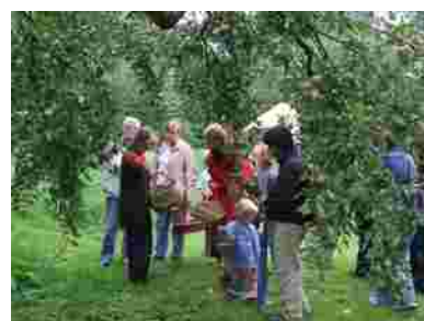
Grensparkdag op 27 augustus 2006

Onder het motto “Mosaïk Grenspark” werd op 27 augustus de diversiteit van het Grenspark Maas-Swalm-Nette door 12 deelnemende bezoekerscentra getoond. Tevens werden fietsroutes met een speciale thema’s aangeboden. De uitgewerkte routes vormen een verbinding tussen de verschillende bezoekerscentra. In totaal werden op de Grensparkdag 2006 bij de deelnemende centra ongeveer 3500 personen geteld. De Grensparkdag werd georganiseerd door IVN Consulentenschap Limburg, Naturpark Schwalm-Nette en Grenspark Maas-Swalm-Nette de.