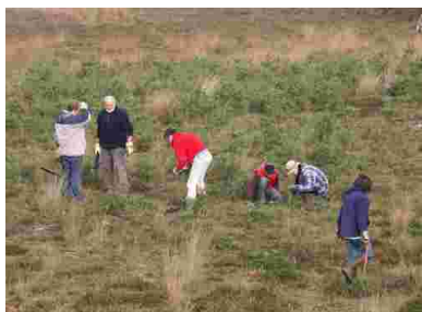
Natuurwerkdag op 4 november 2006

Ook dit jaar vond op de eerste zaterdag in november weer de grensoverschrijdende natuurwerkdag plaats. 45 vrijwilligers namen deel aan het gezamenlijke beheer van de heide in natuurbeschermingsgebied Elmpter Schwalmbruch in de gemeente Niederkrüchten. De natuurwerkdag was een gezamenlijke actie van Staatsbosbeheer Regio Zuid, IVN Consulentenschap Limburg, Forstamt Mönchengladbach, Biologisch Station Krickenbecker Seen, Naturpark Schwalm-Nette en het Grenspark Maas-Swalm-Nette.