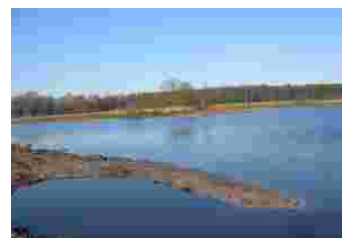
Neue Artenschutzgewässer im NSG Lüsekamp

In 2006 werd de aanleg van de drie poelen in het noordelijke deel van het natuurbeschermingsgebied Lüsekamp en Boschbeekdal gerealiseerd.