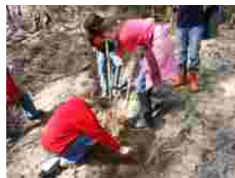
Boomplantdag op 22 maart 2006

In maart 2006 werden in de buurt van het bezoekerscentrum het Nationaalpark de Meinweg, beuken en eiken geplant door in totaal 60 scholieren van de basisschool Arsbeck en de basisschool St. Sebastianus uit Herkenbosch. Deze actie werd georganiseerd door Staatsbosbeheer Regio Zuid, IVN Consulentenschap Limburg, Forstamt Mönchengladbach, Naturpark Schwalm-Nette en de gemeente Roerdalen.